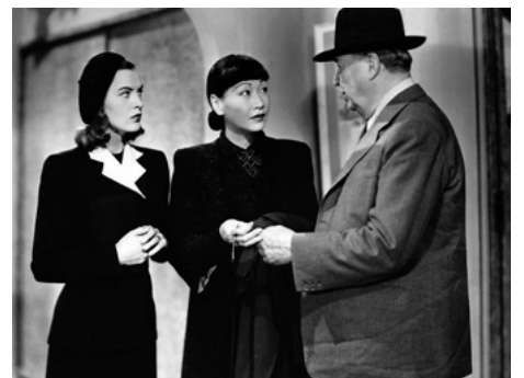
1943 IMPACT (Impact) d'Arthur Lubin avec Ella Raines, Charles Coburn