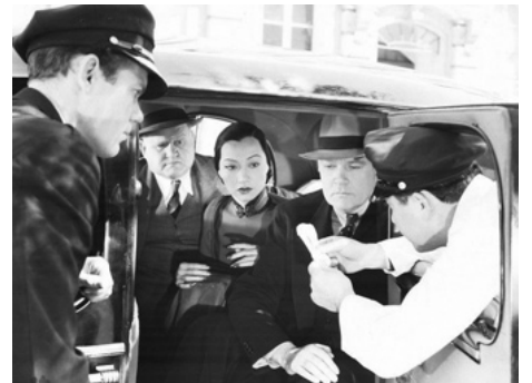
1938 WHEN WERE YOU BORN de William C. McGann avec Charles Wilson