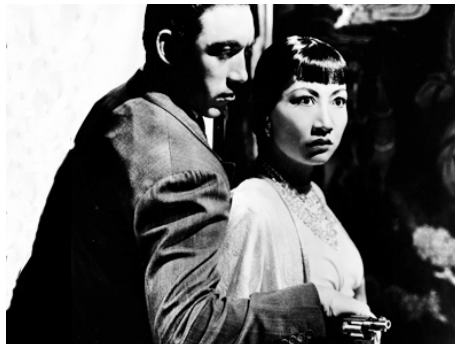
1938 DANGEREUX À CONNAÎTRE (Dangerous to know) de Robert Florey avec Anthony Quinn