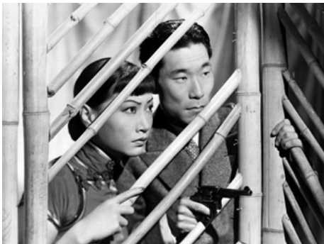
1937 LA FILLE DE SHANGHAI (Daughter of Shanghai) de Robert Florey avec Philip Ahn