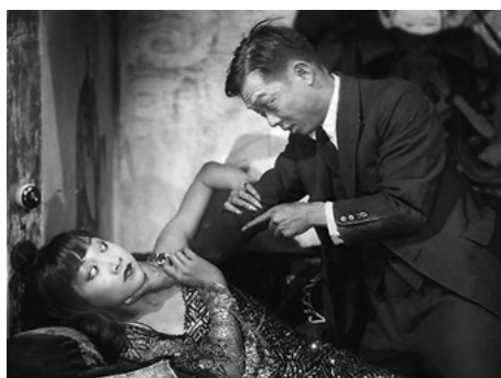
1929 PICCADILLY (Piccadilly) d'Ewald André Dupont avec King Ho Chang