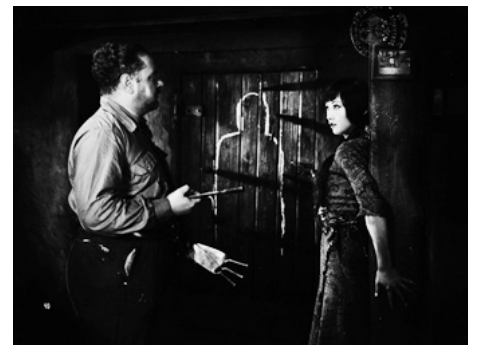
1928 ANGE MAUDIT (Schutziges Geld) de Richard Eichberg avec Heinrich George