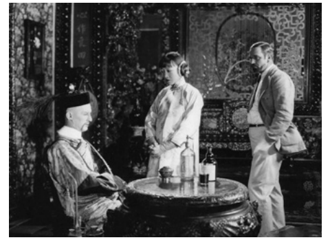
1923 LA MARCHANDE DE RÊVES (Drifting) de Tod Browning avec William V. Wong, W. Beery