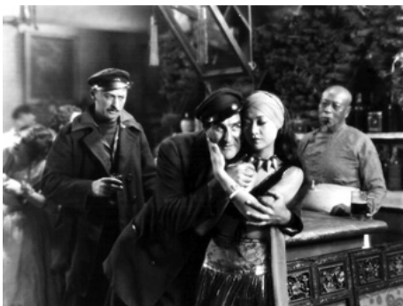
1928 UN SOIR À SINGAPOUR (Across to Singapore) de William Nigh avec Ernest Torrence