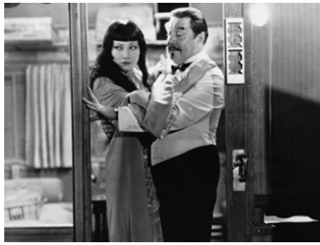
1932 SHANGHAI EXPRESS (Shanghai Express) de Josef von Sternberg avec Warner Oland