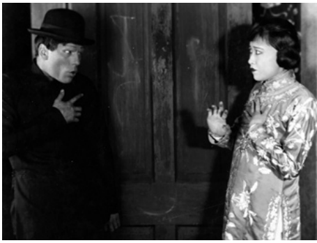
1921 BITS OF LIFE de James Flood et Marshall Neilan avec Lon Chaney