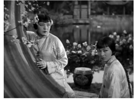
1927 MONSIEUR WU (Mr Wu) de William Nigh avec Renée Adorée