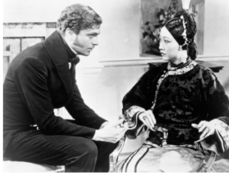
1934 JAVA HEAD de J. Walter Ruben avec John Loder