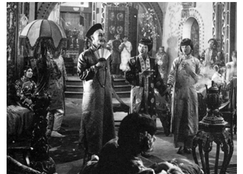
1928 THE CRIMSON CITY d'Archie Mayo avec Sô Jin