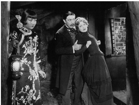
1927 OLD SAN FRANCISCO d'Alan Crosland avec Warner Oland, Dolores Costello