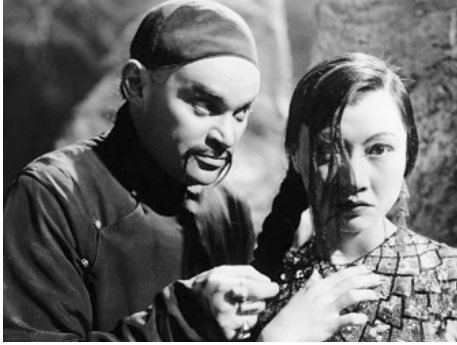
1934 CHU CHIN CHOW de Walter Forde avec George Robey