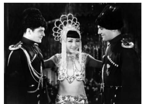
1930 LA ROUTE DU DÉSHONNEUR (Der Weg zur Schande) de R. Eichberg avec Francis Lederer