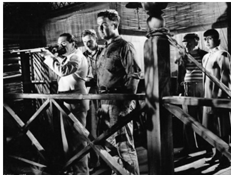
1939 L'ÎLE DES HOMMES PERDUS (Island of Lost Men) de Kurt Neuman avec Eric Blore, J. Carrol Naish