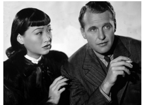
1941 ELLERY QUEEN'S PENTHOUSE MYSTERY de James P Hogan avec Ralph Bellamy