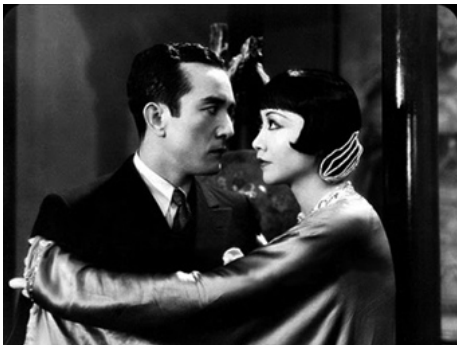
1931 LA FILLE DU DRAGON (Daughter of the Dragon) de Lloyd Corrigan avec Sessue Hayakawa