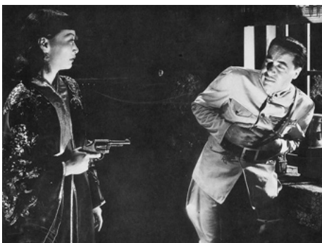
1942 LA DAME DE CHONGQING (Lady from Chongking) de William Nigh avec Harold Huber