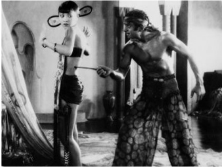
1924 LE VOLEUR DE BAGDAD (The Thief of Bagdad) de Raoul Walsh avec Douglas Fairbanks Sr