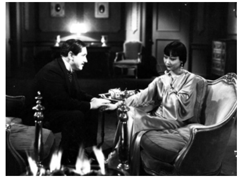
1933 A STUDY IN SCARLET d'Edwin L. Marin avec Reginald Owen