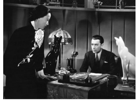
1934 LIMEHOUSE BLUES d'Alexander Hall avec George Raft