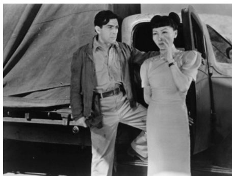
1943 BOMBS OVER BURMA de Joseph H. Lewis avec Ned Young