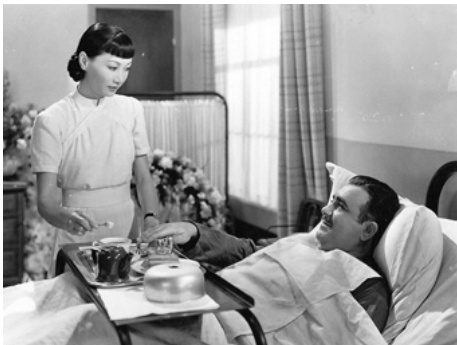
1939 LE ROI DE CHINATOWN (King of Chinatown) de Nick Grinde avec Akim Tamiroff