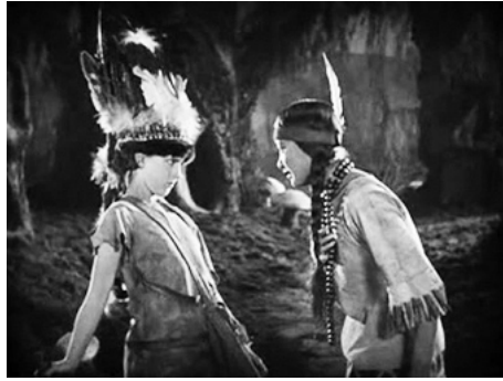
1924 PETER PAN (Peter Pan) de Herbert Brenon avec Betty Bronson